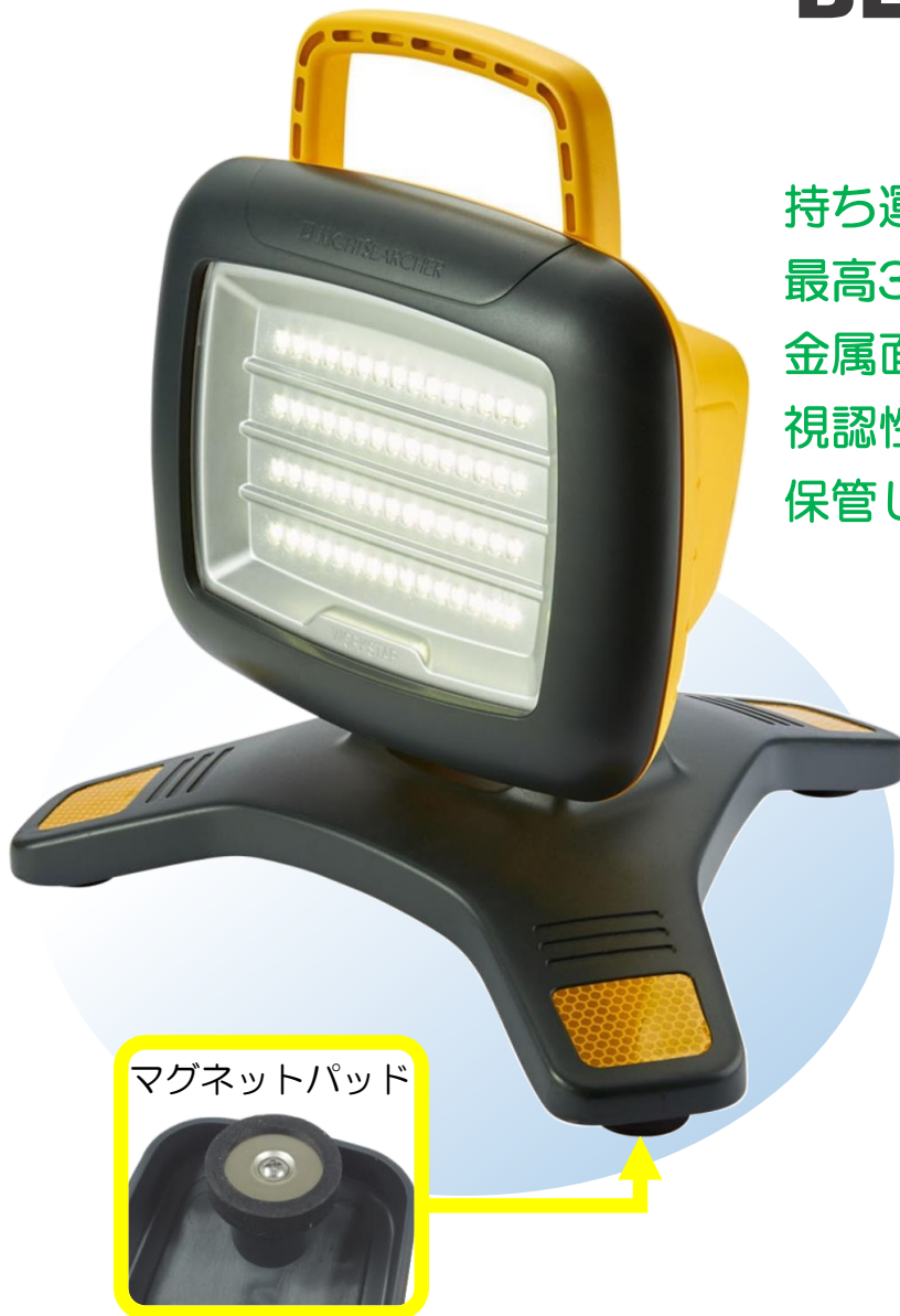
マグネットパッド

持ち運びやすい軽量ボディ 最高3500ルーメンの明るさ 金属面に設置できるマグネットパッド付 視認性が高い3つの反射板 保管しやすいリチウムイオン電池式