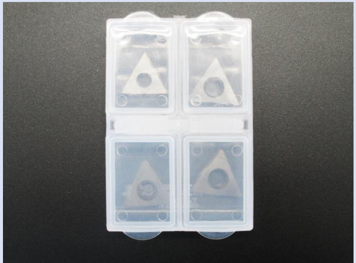
替刃(スローアウェイチップ4個入)

※性能向上、作業性を良くするため、予告なく仕様の一部を変更する場合がありますので、予めご了承ください。