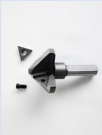
専用カッターシャンク