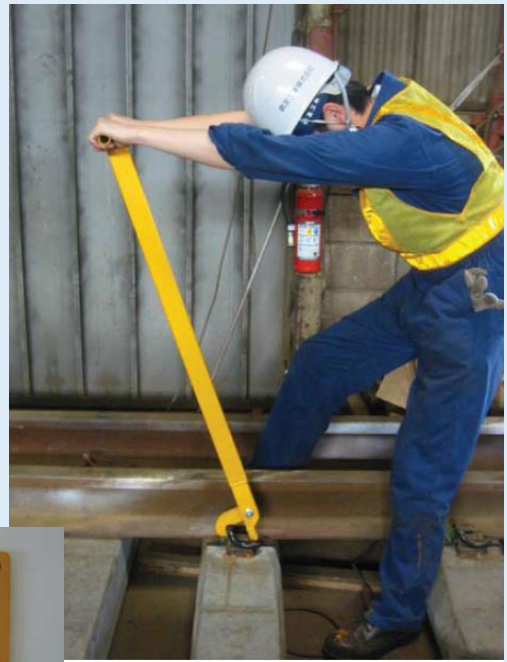
( 取り外し時 )