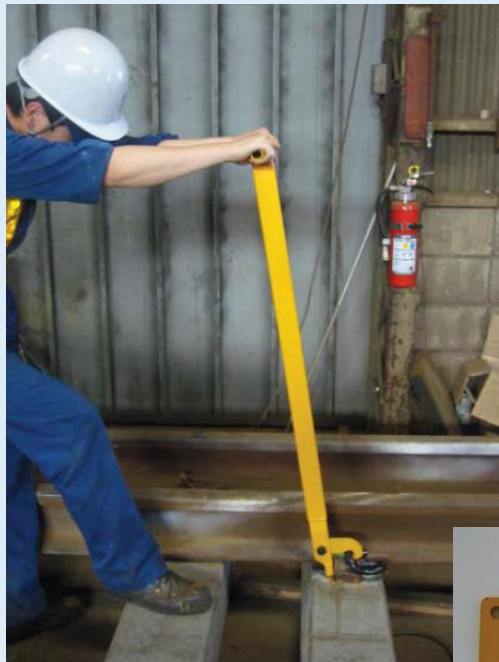
( 締結時 )