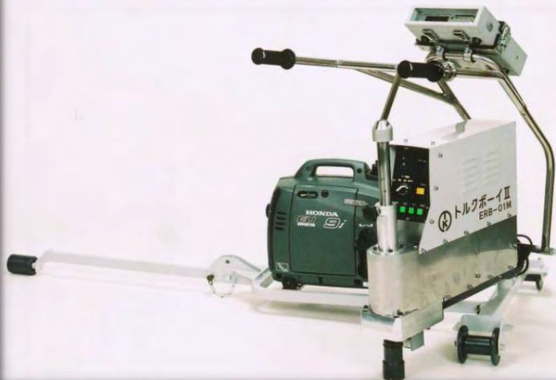
オプション：PCマクラギ用注油装置