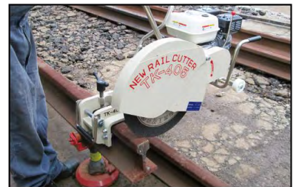
◆緊張器をかけたまま切断可能