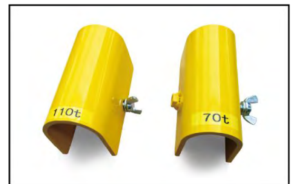
◆ガイスマー緊張器用ロッドガード(70t, 110t 用)