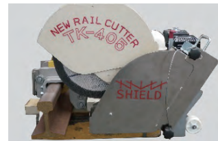
シールド格納状態