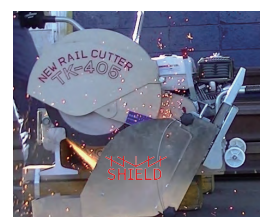
シールド有り 火花状態