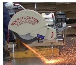
シールド無し 火花状態