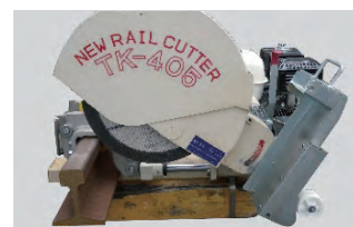
シールド取り外し状態